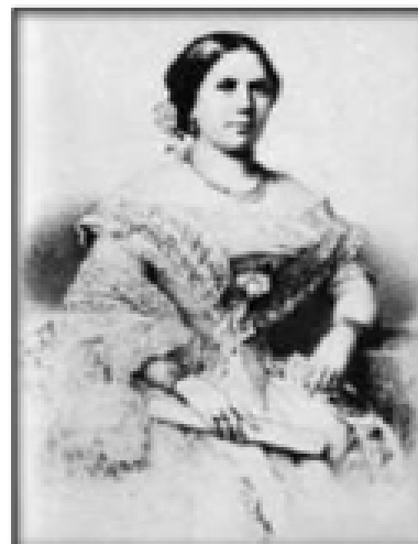
Певица Дарья Леонова. С литографии. 1880-е гг.