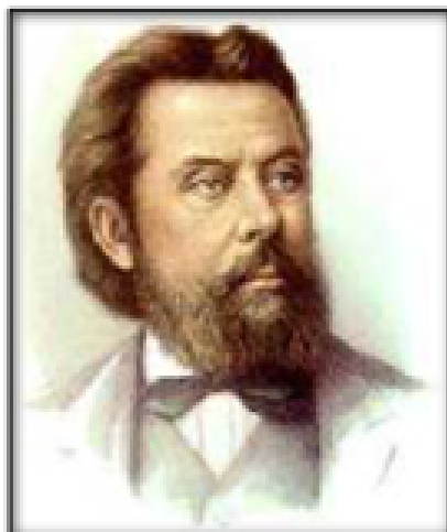
М. П. Мусоргский

М. П. Мусоргский – великий композитор-реалист, правдиво изображающий жизнь во всей её сложности и многообразии. Один из самых ярких и самобытных композиторов XIX века.