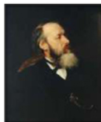
Илья Репин. Портрет В. В. Стасова. 1883 г.