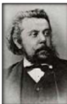
М. П. Мусоргский