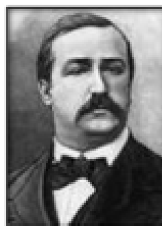
А. П. Бородин