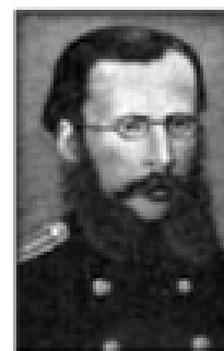
С. А. Кюи