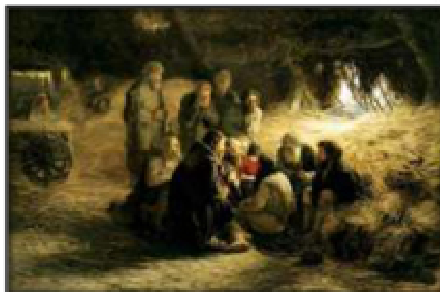
Григорий Мясоедов. Чтение Положения 1861 года. 1873 г.

Задание 1 Общая характеристика развития русской музыки в 60-70 годы XIX века.